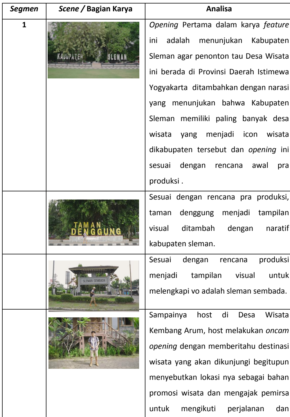
Tabel 1. Analisis Karya

Berikut penjelasan mengenai analisis karya Feature Desa Wisata Kembangarum dengan durasi karya 24 menit. Target audiens ialah laki-laki dan perempuan dengan rentang usia semua umur.