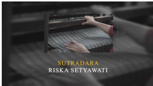
Gambar 2 Screenshot gambar credit tittle program