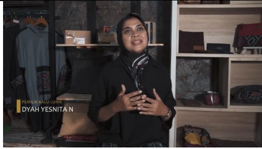
Gambar 24 Screenshot pengambilan gambar medium shot