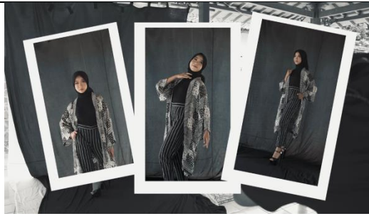
Gambar 27 Screenshot hasil foto model