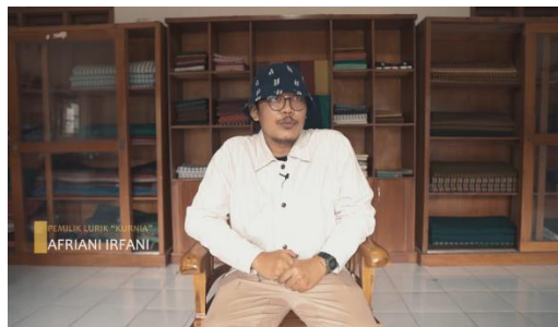
Gambar 17 Screenshot pengambilan gambar medium shot