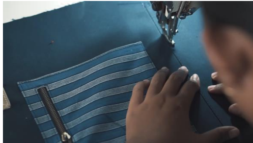
Gambar 25 Screenshot pengambilan gambar close up