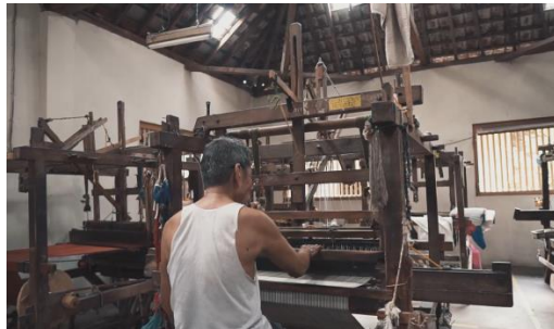
Gambar 19 Screenshot pengambilan gambar full shot