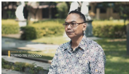
Gambar 9 Screenshot pengambilan gambar medium close up