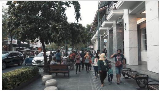
Gambar 7 Screenshot pengambilan gambar long shot