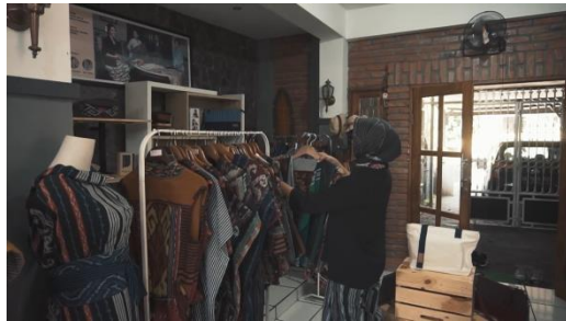
Gambar 21 Screenshot pengambilan gambar full shot