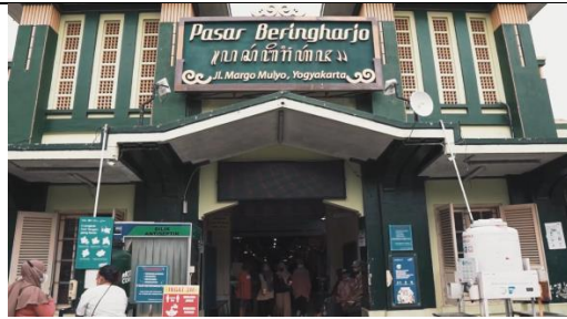
Gambar 15 Screenshot pengambilan gambar full shot