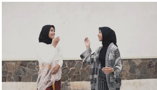
Gambar 1 Screenshot pengambilan gambar medium shot