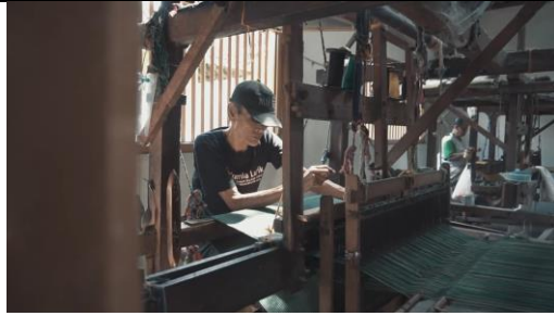
Gambar 10 Screenshot pengambilan gambar medium shot