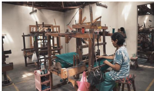
Gambar 20 Screenshot pengambilan gambar full shot