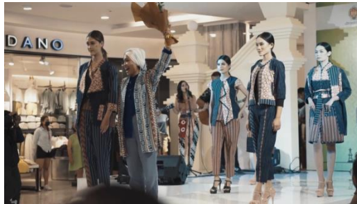
Gambar 26 Screenshot pengambilan gambar full shot