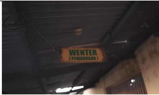
Gambar 18 Screenshot pengambilan gambar close up