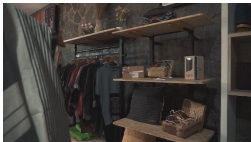
Gambar 22 Screenshot pengambilan gambar full shot