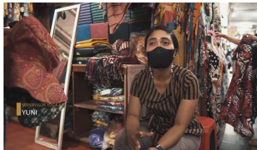
Gambar 16 Screenshot pengambilan gambar medium shot