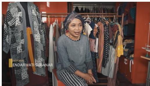
Gambar 23 Screenshot pengambilan gambar medium shot