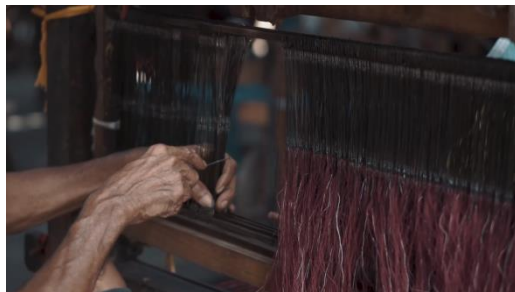
Gambar 11 Screenshot pengambilan gambar close up